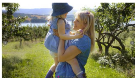
HUN ER NORGES STØRSTE SOLBÆRERODUSENT