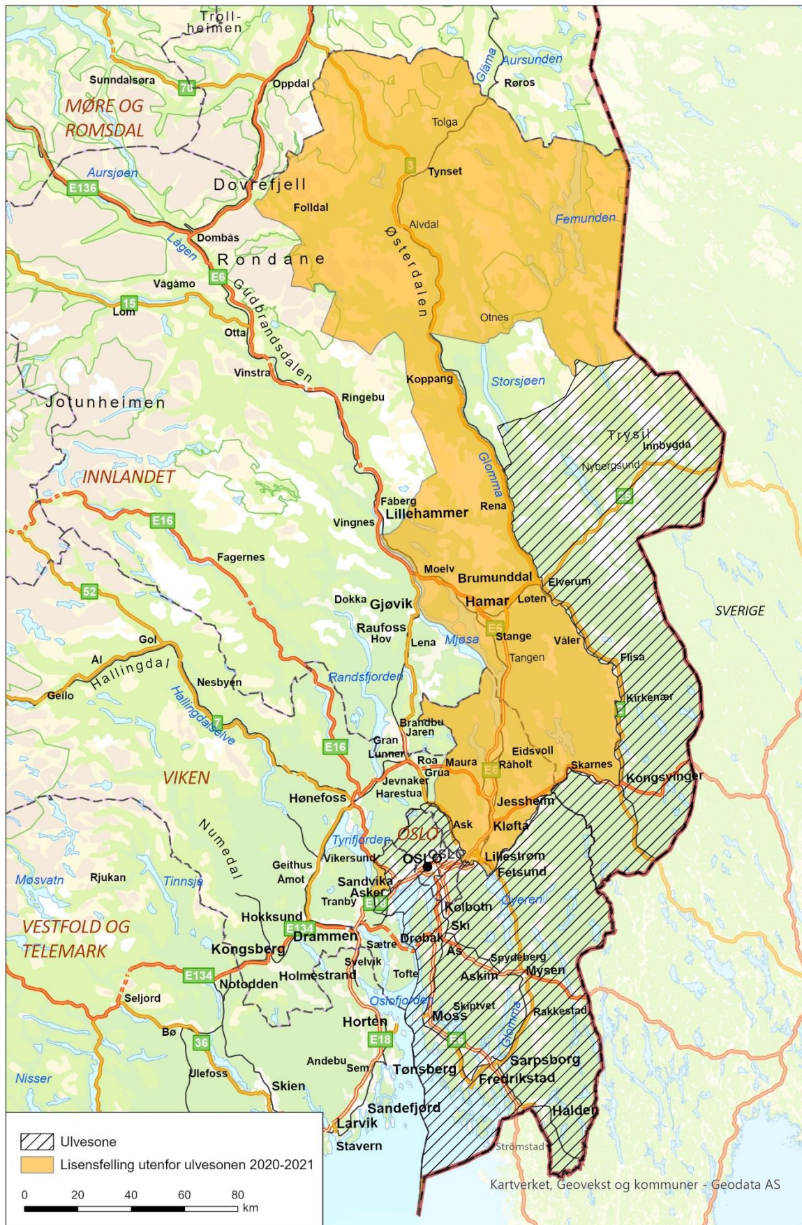
Kart over foreslått område for lisensfelling 2020/2020